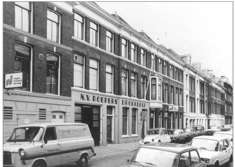
1981 - Drukkerij Roepers aan de Barentszstraat.

De drukkerijmachines stonden op de begane vloer van pand met nummer 10 die bereikbaar was via een toeg aan de achterzijde van nummer 8. Op de bovenetage van machines woonde de directie van de drukkerij die in verloop van de jaren wisselende. Het kantoor van de directie zat tussen de panden met nummers 10 en 12 in. Op de begane vloer van nummer 12 was de handzetterij aan de achterzijde gevestigd. Het kantoor van de Roepers drukkerij was op nummer 14 ondergebracht.