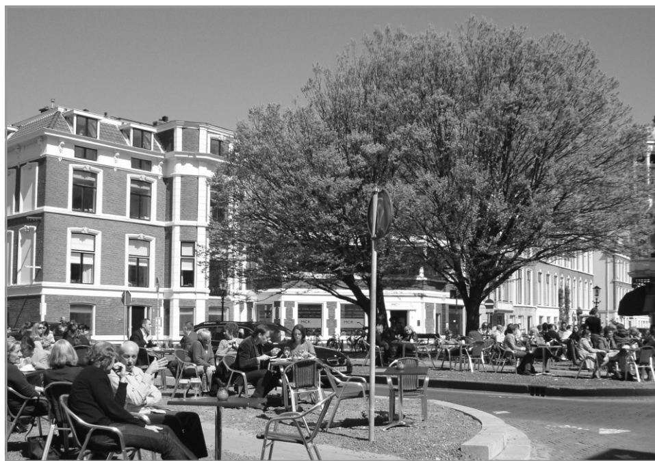
Een nieuw terras seizoen, met nieuw terrasmeubilair, op het Anna Paulownaplein.

Kortom, het op korte termijn instellen van een tijdelijke parkeervoorziening op het braakliggend terrein van de Mauritskade is absoluut geen overbodige ingreep!