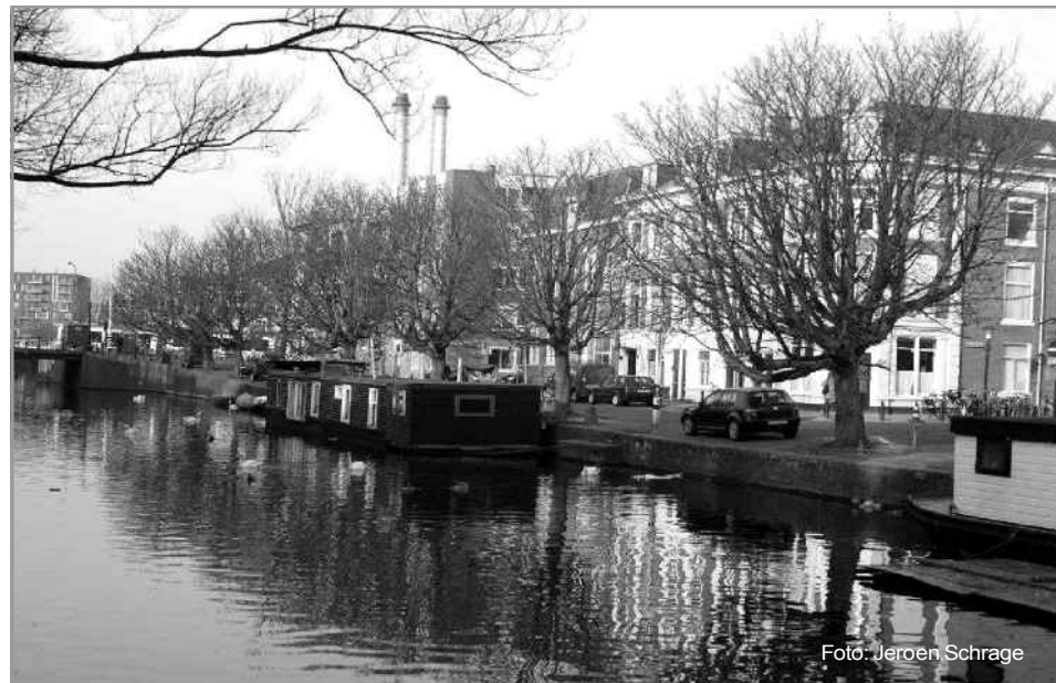
Een van de laatste foto's van de 22 kastanjes aan de Veenkade. Wegens vernieuwing van de kademuur zijn de bomen op 18 maart gekapt.

Verzoek aan wethouder Smit: Breidt betaald parkeren in geheel het Zeeheldenkwartier tot 22.00u uit en zorg dat er bij het parkeerregime in de winkelstraten een afwijkende regeling wordt toegepast (d.w.z. tot sluitingstijd = tot 18.00 uur).