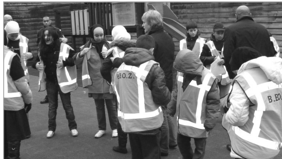
Veegactie met leerlingen van de Da Costaschool.

De medewerkers helpen mee aan het schoon, heel en veilig houden van de wijk. Dat doen ze door onder meer hondenpoep te verwijderen, zwerfvuil weg te halen (ook uit plantsoenen), afvalbakken te legen, zitbanken en hekken te onderhouden en graffiti te verwijderen. Op www.BBOZ.nl staat een overzicht van al het werk dat zij uitvoeren. Verder beheert de BBOZ de kinderboerderij Het Beestenspul en stuurt de jongerenprojecten in het Zeeheldenkwartier en Kortenbos aan.