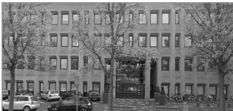
Wijkbureau Karnebeek is gehuisvest in het pand van Hoofdbureau Politie Haaglanden aan de Burgemeester Patijnlaan 35.

Tijdens het politiekdebat Zeeheldenkwartier, georganiseerd door bewonersorganisatie De Groene Eland, deden verontruste bewoners verslag van het gerucht dat wijkbureau Karnebeek zal worden opgeheven. De bewoners zijn met name bezorgd dat dit gevolgen zal hebben voor de inzet van de politie in de wijk. De fracties van de PvdA, D66, SP en GroenLinks vinden dit een zorgelijk teken en hebben daarom schriftelijk onderstaande vragen gesteld aan het college van burgemeester en wethouders.