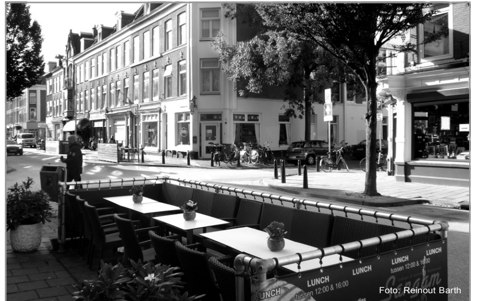
De Prins Hendrikstraat zal een van de winkelstraten in het Zeeheldenkwartier zijn waarvoor de Bedrijven Investerings Zone gaat gelden, als de ondernemers voor het BIZ-plan stemmen.

Het Zeeheldenkwartier zit in de laatste ronde van het traject: Tenminste de helft van onze ondernemers, 110 dus, moeten hun stem uitbrengen en daarvan moet tweederde deel voor de BIZ stemmen. Op 18 november 2011 sluit de stemming, waarna alle stemmen worden geteld en duidelijk wordt of er ja of nee een BIZ komt in het Zeeheldenkwartier.