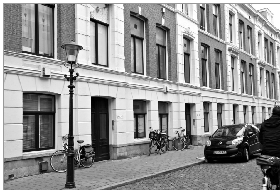
Gevels van het wooncomplex met HAT-woningen in de Van Speijkstraat.

Haag Wonen verhuurt in het Zeeheldenkwartier in totaal 150 HAT-woningen. Ze bevinden zich in de van Speijkstraat, van de Spiegelstraat, Hugo de Grootstraat, de Ruijterstraat, van Galenstraat en de Anna Paulownastraat. De woningen hebben een huurprijs tussen de 225,- en 375,- euro per maand en worden verhuurd via www.woonnet-haaglanden.nl en de woonkrant Beter Wonen. Een HAT-woning bestaat uit één of twee kamers, meestal met een keukenblok in de woonkamer. Tegenwoordig zijn de HAT-woningen in het Zeeheldenkwartier uitsluitend bedoeld voor mensen tot 23 jaar.