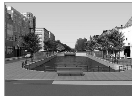
De historische gracht wordt teruggebracht en wordt even breed als de gracht aan de andere zijde van de Torenstraatbrug.

De bestemmingsaanpassingen voor dit project komen in grote lijnen neer op het invoegen van de VAB met de bovengelegen gracht. Aan alle zijden van het nieuwe grachtgedeelte komt verkeersruimte. De Torenstraatbrug heeft een verkeersfunctie voor tram-, auto- en fietsverkeer in twee richtingen. De Noordwal behoudt de huidige verkeersfunctie in één richting, waarbij een uitvoegstrook leidt tot een toegangsportaal van de autoberging. De Prinsewal behoudt eveneens zijn huidige verkeersfunctie. Voor de Veenkade tot aan de Bilderdijkstraat geldt dat er een verblijfsgebied komt dat alleen toegankelijk is voor voetgangers, fietsers, nood- en