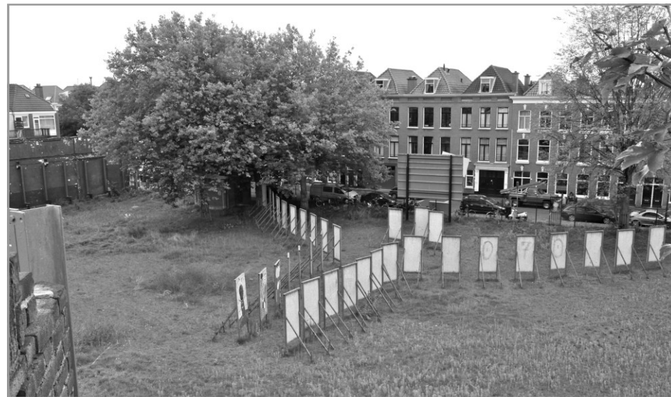
Het braakliggende terrein aan de Tasmanstraat.

De woningen worden te zijner tijd verhuurd via de website www.woonnet-haaglanden.nl . Om in aanmerking te komen voor deze woningen, moeten belangstellenden voldoen aan een minimale en een maximale inkomenseis.