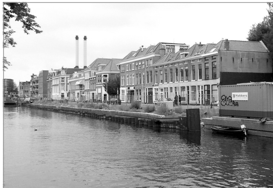
De werkzaamheden aan de kademuur van de Veenkade zijn weer hervat.

Politiebureau Karnebeek, wijkbureau voor Zeeheldenkwartier, heeft een mailbox voor vragen en opmerkingen van wijkbewoners: bur.karnebeek@haaglanden.politie.nl Op uw e-mail krijgt u altijd een reactie.