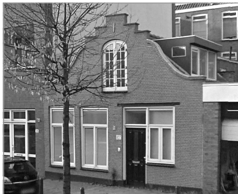
Gaat dit markante geveltje aan de Elandstraat verdwijnen? De bewoner heeft een sloopvergunning aangevraagd. Het karakteristieke pandje werd in 2006 nog gerenoveerd, maar is behoorlijk verzakt. Als sloop mag, hoopt hij een groter pand neer te zetten voor zijn kantoor en enkele appartementen. De gemeente heeft de aanvraag nog in behandeling.

De gemeente draagt zorg voor een schone, hele en veilige leefomgeving. Dit kan niet zonder uw hulp. Als u op straat iets ziet dat niet in orde is of overlast van een bedrijf heeft, kunt u dit melden. Denk hierbij aan gaten in de straat, beschadigd straatmeubilair, een gebroken tak die gevaarlijk hangt, geluids- of stankoverlast of afval op straat dat er reeds langere tijd ligt.