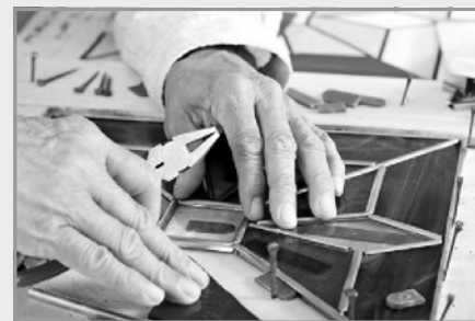
Workshop glas in lood.

Het leuke van Fimo klei kralen maken is dat je enorm veel verschillende kralen kunt maken, en jij bepaalt helemaal hoe je zelfgemaakte fimo kraal eruit gaat zien! Je kunt simpele kralen van één kleur maken, gemarmerde kralen, kralen met Stras steentjes en kralen op basis van je eigen creativiteit. Met de zelf gemaakte kralen, maakt u uw eigen persoonlijke sieraad!