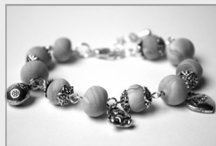
Armband van Fimo klei kralen.

Beschilder/sjabloner een prachtig servies, dat geschikt is voor dagelijks gebruik. Iedereen kan het, ook met behulp van meer dan 300 sjabloon-tjes, maar uit de hand schilderen is natuurlijk wel zo leuk. Er wordt gewerkt met professionele porcelainverf, zodat het servies ook in de afwasmachine kan. Ook leuk voor de kinderen!