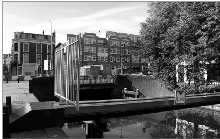
Tijdelijke brug tussen de Prinsessewal en de Toussaintkade (rechts) voor het omleggen van kabels en leidingen.

Voor de doorstroming van het water tijdens de bouw kunnen er nu, wat Delfland betreft, voor een paar jaar twee enorme buizen (elk ca. 2 meter in doorsnee) vlak langs de fundamenten van de bebouwing aan de Veenkade aangelegd worden. Let wel, Delfland heeft alleen de zorg voor het water en alles daarom heen en spreekt zich dus beslist niet uit over nut en noodzaak van de onderhavige bouwwerken.