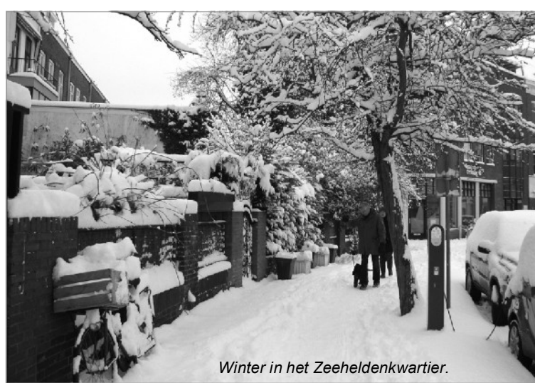
Winter in het Zeeheldenkwartier.