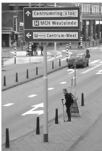
Halte busje 17 in de Elandstraat.

Bij de tramhaltes staan borden met een hoop tekst die niet te begrijpen is voor buitenlandse inwoners en analfabeten. Dat moet in het vervolg toch anders kunnen met wat goede pictogrammen.