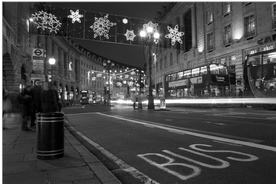
Regent Street in Londen is de eerste foto uit het project 'Groeten uit Europa... in het Zeeheldenkwartier', geïnstalleerd in de Piet Heinstraat op nummer 83.

Projectpartners: Gemeente Den Haag & IXIN / Inge Niks, PHOTOLOGIX.NL / Bruno van den Elshout, Guthschmidt / Marieke Claus