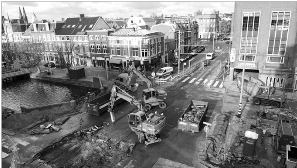
Het asfalt en de tramrails worden van de Torenstraatbrug verwijderd.

De aannemer is direct aan de slag gegaan met het verwijderen van tramrails, bovenleiding, asfalt, oude kademuren en het leuningwerk van de brug. In de toekomst behoudt ook de nieuwe Torenstraatbrug haar historische uitstraling, omdat het oude leuningwerk opnieuw wordt gebruikt. Bij de Toussaintkadebrug zijn de palen voor de fundering van de landhoofden aangebracht en het brugdek van de brug verwijderd.