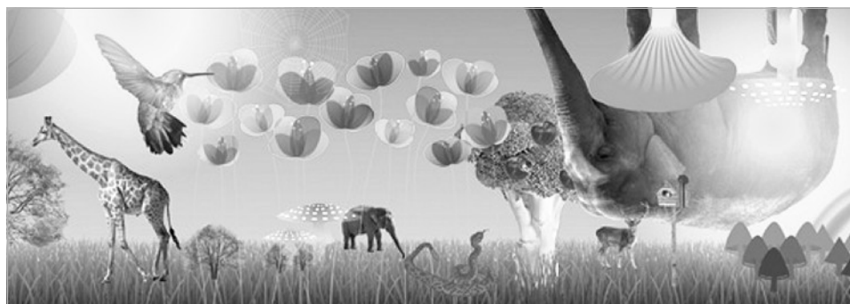
Een uitsnede van het ontwerp van Stephan Csikos.

Vanaf half maart worden de tijdelijke bouwhekken rondom het bouwterrein Noordwal-Veenkade vervangen door houten bouwschuttingen. Om er voor te zorgen dat de omgeving van het bouwterrein ook tijdens de uitvoering van het project er aantrekkelijk uit blijft zien, wordt een groot deel van de schutting voorzien van een mooi ontwerp. Elf ontwerpers uit het Hofkwartier maken op initiatief van het bureau Ontwerpwerk en met input van de directe omgeving van het werkterrein een ontwerp voor de 164 meter lange bouwschutting. Ook komen er kijkgaten die voorbijgangers de kans geven het werk te volgen. Omstreeks eind maart is de schutting te bewonderen. Aanstaande zomer kan men vanaf een uitkijkpost uitkijken op het bouwterrein en zien hoe het werk de diepte ingaat. De post wordt geplaatst aan de Veenkade bij de Bilderdijkstraat.