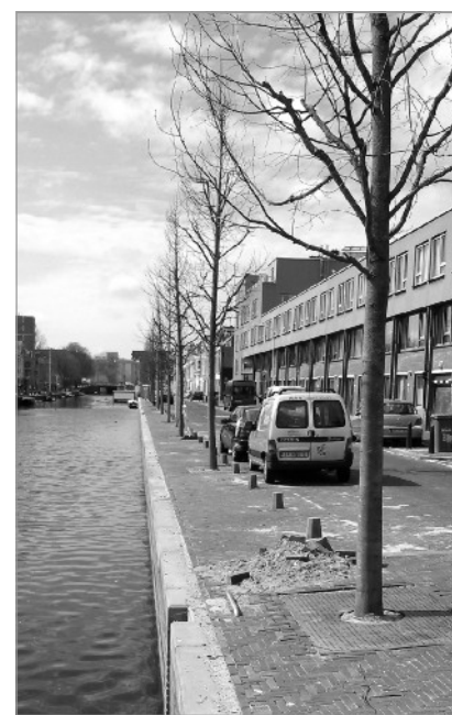
Onlangs zijn er aan de Veenkade 22 lindes geplant ter vervanging van de in 2010 gekapte kastanjes.

Wat betreft de Elandstraat blijft de vraag echter of de bomen die daar uiteindelijk zijn geplant de 'goedkeuring van de gemeente' hadden. En als dat al zo is, waarom konden mensen er dan geen bezwaar tegen maken? Immers, het gaat hier om bomen die maar liefst zeven meter hoger groeien dan de bomen (van 8m) waar men bezwaar tegen had kunnen maken op grond van de gepubliceerde kapvergunning.