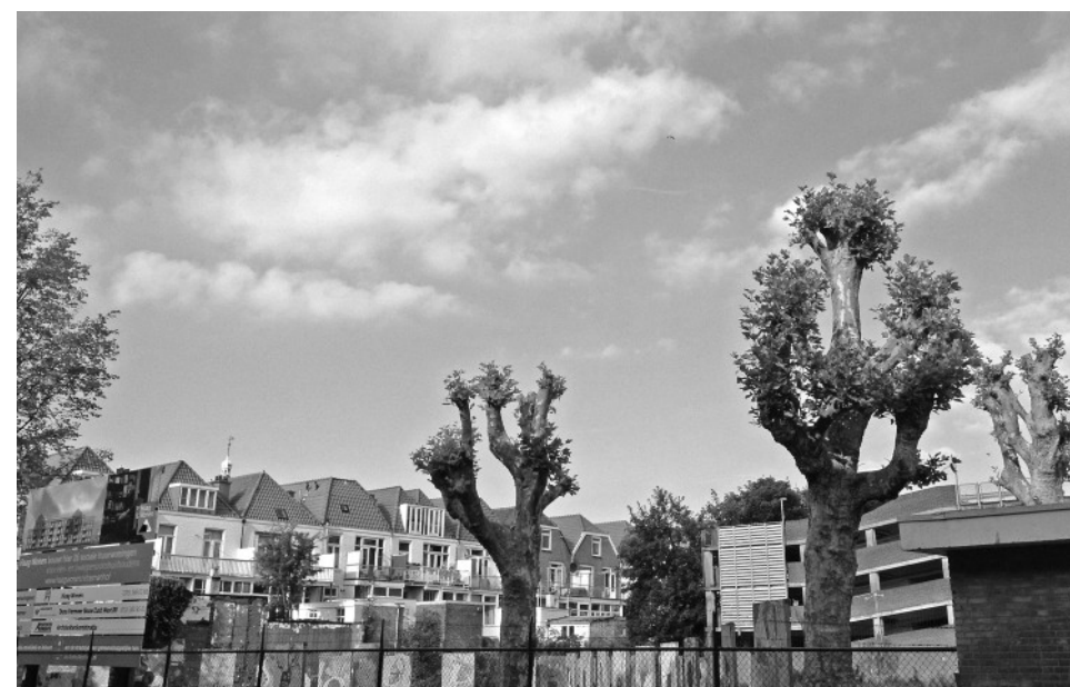
De in juli gesnoeië platanen zijn weer mooi uitgelopen.

De platanen op het stuk grond aan de Tasmanstraat staan na het terugsnijden van afgelopen juli weer in bloei. De uitlopers groeien en hebben weer blad. De platanen worden onderdeel van de Zeeheldentuin. Aannemer Dura Vermeer zal de komende tijd de bouwplaats inrichten en de bomen en hun wortels beschermen.