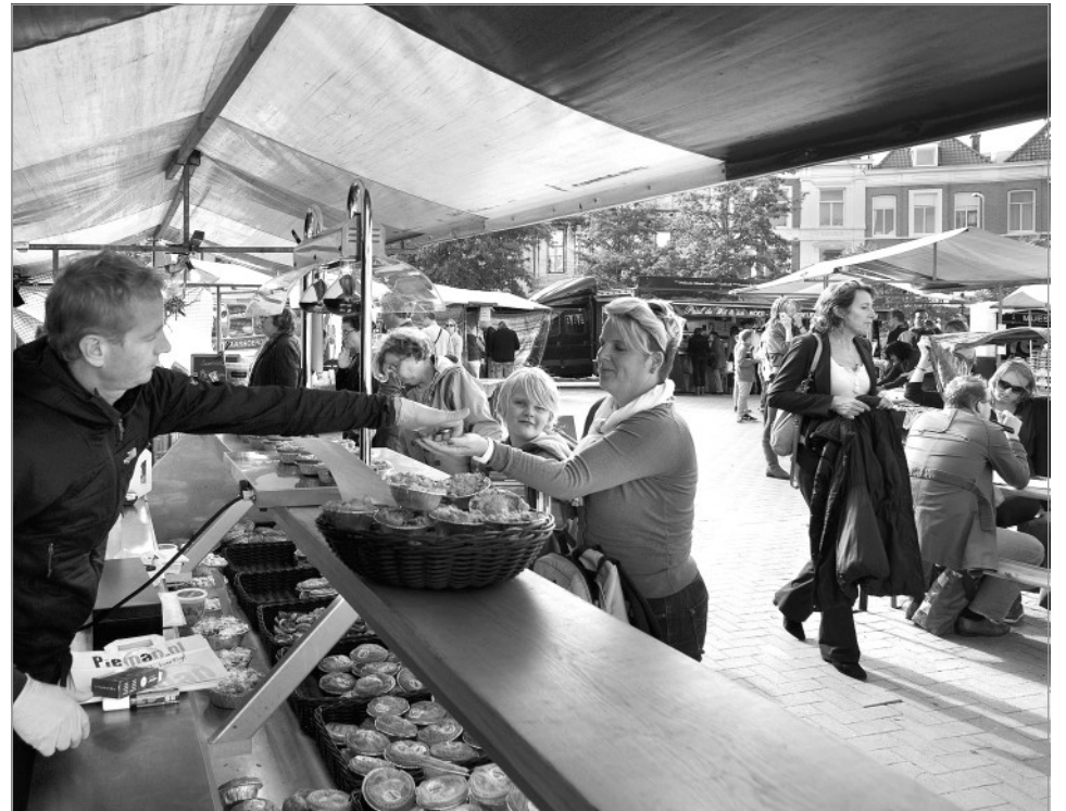
Vanaf 17 oktober wordt iedere donderdag, van 11.00 tot 19.00 uur, op het Prins Hendrikplein een duurzame weekmarkt gehouden, met dagverse en ambachtelijke producten uit de regio.