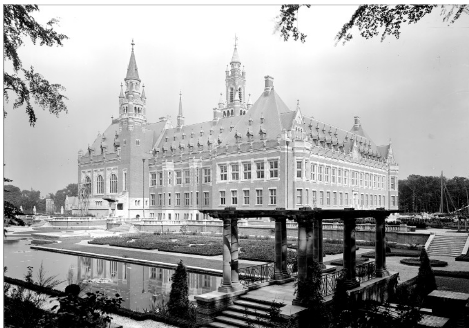
Een historische foto van de zijkant van het Vredespaleis. Het is een groot, carrévormig gebouw met een plint van grijze Belgische natuursteen en gevels van rode Hollandse baksteen in een eclectische neorenaissancistische stijl. Om het gebouw liggen tuinen die tot de meest geslaagde ontwerpen behoren van de Engelse landschapsarchitect Thomas Mawson. Voor de vijvers maakte Mawson handig gebruik van een natuurlijke waterloop door het terrein, de beroemde Haagse Beek. Het Vredespaleis is in zes jaar tijd gebouwd.

Bezoek dan het bezoekerscentrum of doe mee aan een rondleiding. Het bezoekerscentrum van het Vredespaleis is geopend van dinsdag t/m zondag van 10.00 tot 17.00 uur. Een eigentijdse tentoonstelling en indrukwekkende film geven in 30 tot 45 minuten een introductie op het ontstaan van het paleis en de instellingen die erin zijn gevestigd. De informatie is beschikbaar via een audiotour in zeven talen. De toegang is gratis. Kaarten voor een rondleiding van 45 minuten door het gebouw zijn via de website www.vredespaleis.nl te koop.