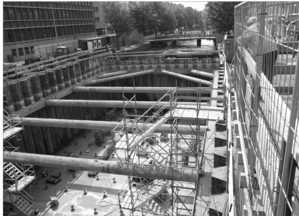
Deze zomer is in de gracht de betonvloer gestort voor de parkeergarage aan de Veenkade. Half augustus is het water weggepompt en werd de vloer zichtbaar. De vloer ligt bijna acht meter onder het waterpeil. De bouw ligt volgens de gemeente op schema wat betekent dat de Torenstraatbrug in december weer voor het verkeer opengaat en de tram dan weer gaat rijden.

Voor meer informatie over het programma zie www.dichteraanhuis.nl